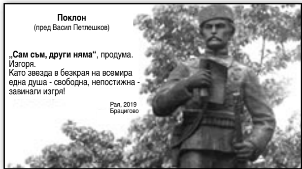
Поклон (пред Васил Петлешков)

Като продължителен камбанен звън отекват думите на брациговския апостол Васил Петлешков и днес – 144 години по-късно.