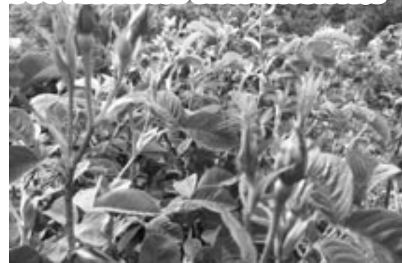
(Снимката е от 20.04.2020 г.)

Цената, която розопреработвателите фиксират – 1.80-2.00 лв./кг, категорично се отхвърля от розопроизводителите като оправдаващо провеждането на кампания 2020 година в условията на извънредно положение! Цената, която розопроизводителите очакват и считат за необходимо условие за провеждане на кампания е, 3 лв., тъй като подсибяването на безопасността на хората и