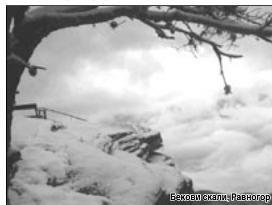
Беклови скали, Равногор