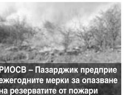
РИОСВ – Пазарджик предприе ежегодните мерки за опазване на резерватите от пожари

Дори оставяйки вкъщи и поддържайки социално дистанциране, все още можем да упражним нашата отговорност да действваме в полза на околната среда. Независимо къде се намираме, ние можем да направим промяната!