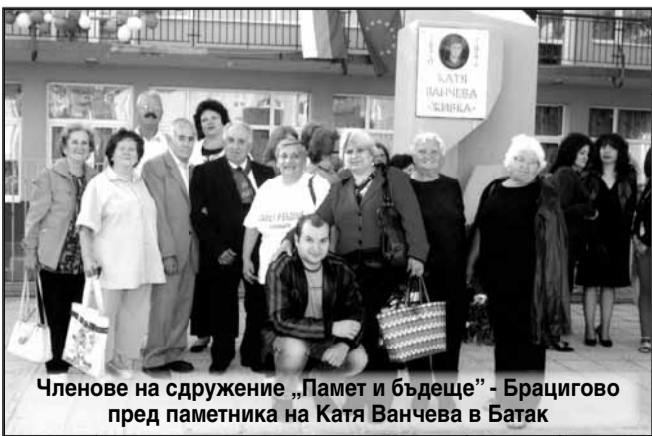
Членове на сдружение „Памет и бъдеще“ - Брацигово пред паметника на Катя Ванчева в Батак

На 14 август 2015 г. наследниците на двамата партизани положиха цветя в Пантеона на слабата в Брацигово като знак на признателност.