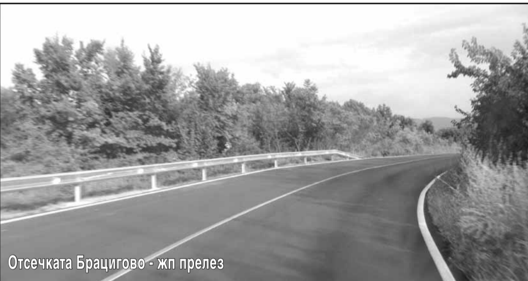
Отсечката Брацигово - жп прелез

Изворите са низходящи. Подземните води са пукнатинни, акумулирани в палеоген - неогенските риолити на Брацигово - Доспатския вулканически масив. Всяка каптажна шахта на изворите е с 2 камери - мокра и суха.