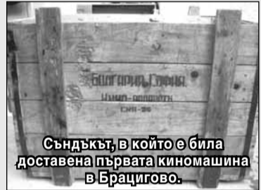
Съндъкът, в който е била доставена първата киномашина в Брацигово.

По едно време погледите на всички се приковават на стената,