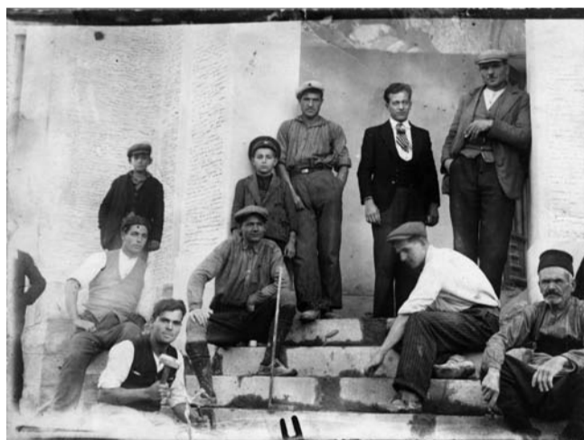
Ученици поставят стъпалата на сградостроителното училище 30-те години на ХХ век