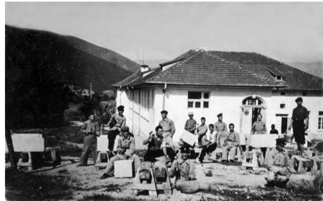
Учебна 1939-40 година – Двора на сградостроителното училище, практика по каменоделство

Между двете световни войни са се дипломирали около 357 възпитаници или средно