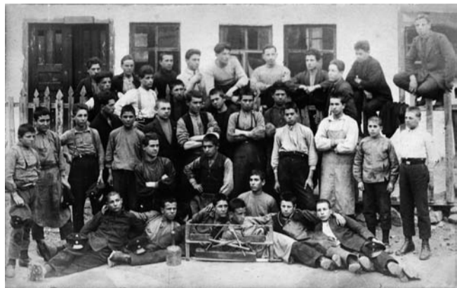
Ученици от столарското училище през 1925 г.

1846 г. дюлгерски еснаф (руфет). С право арх. Пею Бербенлиев, изследовател на архитектурното творчество на брациговските майстори-строители през възраждането, определя създаденото от тях като ШКОЛА - Брациговска архитектурно строителна школа през Възраждането. Брациговските майстори-