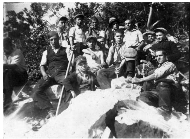
Ученици на практика в мраморна кариера Осиково през 1931 г.

стълби. Срокът на обучение е три години, а приемът след трети прогимназиален клас. Фактическото обучение започва една година по-късно на 1 септември 1913 г., поради участието на България в двете Балкански войни. Първата учебна година започва с 12 редовни и 6 извънредни ученици. За тяхното обуче-