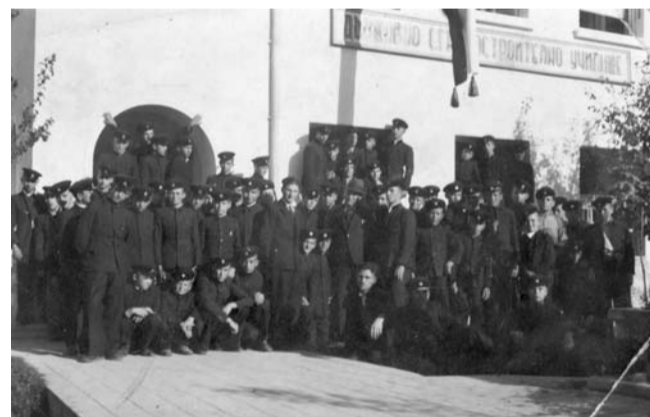
Учебна 1940-41 година - Учениците на празника на Св. Тома