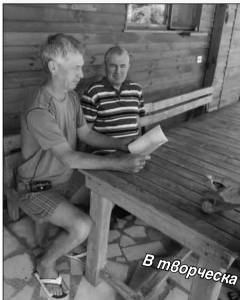
В творческа обстановка