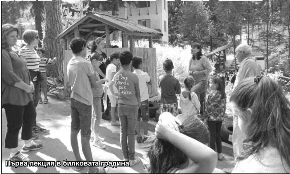
Първа лекция в билковата градина

Това лято новото идва преди всичко с хората - много деца, доста повече млади хора - и голяма част от тях идват от Австрия, Англия, Хърватска, Франция, Гърция. Дори има празници, след които поляната е почти толкова чиста, колкото е била и предиен ден. Хотелите са пълни с гости. Има вече среща на гъбарите. Рушачката се сграда на бившия хотел вече е съборена. Откри се гледка и място за организиране на дейности за спорт, култура и срещи - малко забавено от очаквани разрешения от високи инстанции. Боклуците се изнасят отскоро два пъти седмично, водата се хлорира редовно. Това лято 4 пъти е направен микробиологичен и химичен анализ. Има скромна обществена библиотека, където книгите се позавъртат от читатели. И нека доуточня - заглеждат се хората, взимат по-добрите книги, но, както може да се очаква, не ги връщат. Има, също много скромна, билкова градина, която за следващото лято ще бъде цветна и по-пълна. Въ-