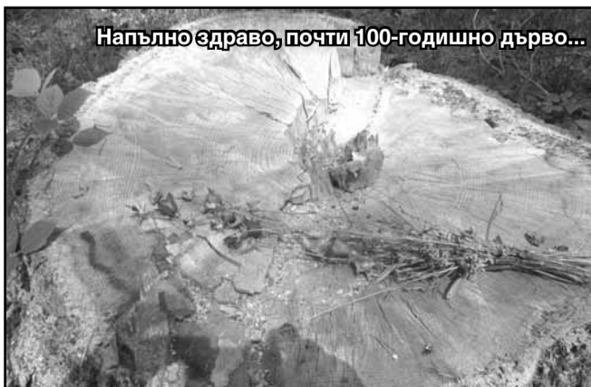
Напълно едриво, почти 100-годишно дърво...