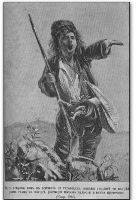
Илюстрация на Боримечката

автор: д-р Малина ДИМИТРОВА предостави: Невена СТЕФАНОВА главен библиотекар при НЧ „В.Петлешков – 1874“