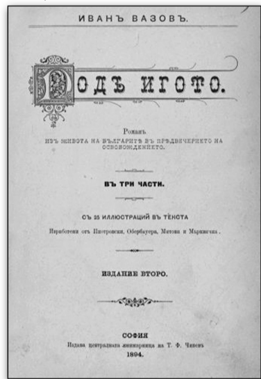
Титулна страница на „Под игото“

През 2019 г. се навършват 125 години от публикуването на първото самостоятелно издание на романа „Под игото“. Годушината е повод да разкажем любопитни и малко известни факти около написването и отпечатването на най-четената и превеждана българска книга.