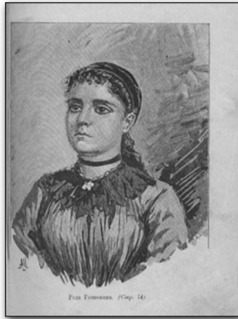
Илюстрация на Рада Госпожина

Договорът, който подписват Иван Вазов и издателят Тодор Чипев е с дата 11 април 1894 г. В него се уточняват параметрите на бъдещото издание: да бъде отпечатано на луксозна хартия, с 25 илюстрации в 3000 екз. тираж. Също така е посочен авторският хонорар, който възлиза на 2500 сребърни лева, както и екземплярите, които ще получи авторът – 25. На титулната страница се уточнява, че изданието е „второ“, появява се и подзаглавие: „Роман из живота на българите в предвечерието на Освобождението“.