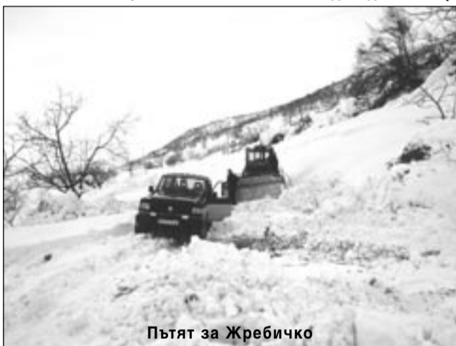
Пътят за Жребиçко

През почивните дни и до късния следобед на 9 март