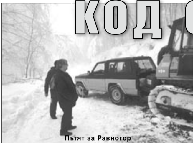
Пътят за Равногор

Обилните снеговалежи подчиниха селата в община Браçигово под снежна покривка. На места тя е от 80 см до 1,20 м. Снегът е тежък и машините на наетата за снеготранспортна фирма не могат да се преборят с големите преспи. Налага се да ги ремонтират през час, почти в движение. Селата Равногор, Розово и Жребиçко са лишени от електроснабдяване четвърто денонощие. Частично ток нямаше в Козарско, Исперихово и Бяга. Пътищата до