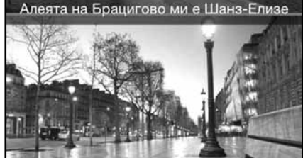
Алеята на Брацигово ми е Шанз-Елизе