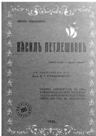
104 страници - цена 3 лв.