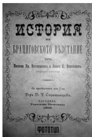
140 страници - цена 4 лв.