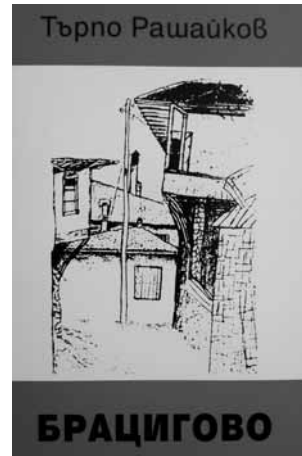
78 страници - цена 3,50 лв.

Книгите се продават в музея на Брацигово (от 9 до 17 ч., без почивен ден), а за доставки - чрез заявка на ел. поща на гражданско сдружение „Памет“ - pametbr36@abv.bg (напишете вашия адрес и телефон)