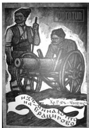
314 страници - цена 4 лв.