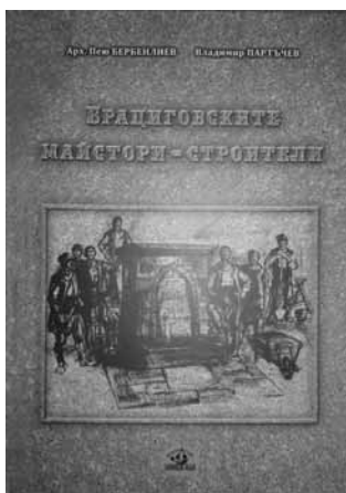
С притурка, 231 страници - цена 20 лв.