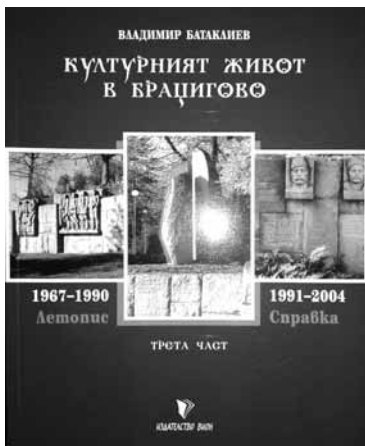
596 страници - цена 10 лв.