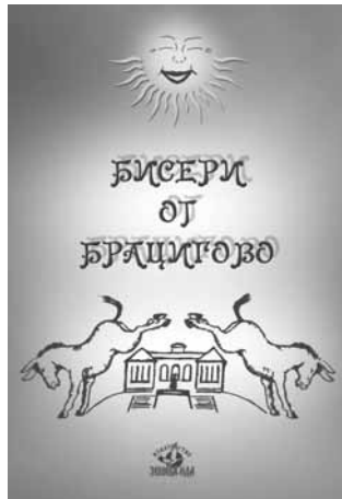
208 страници - цена 6 лв.