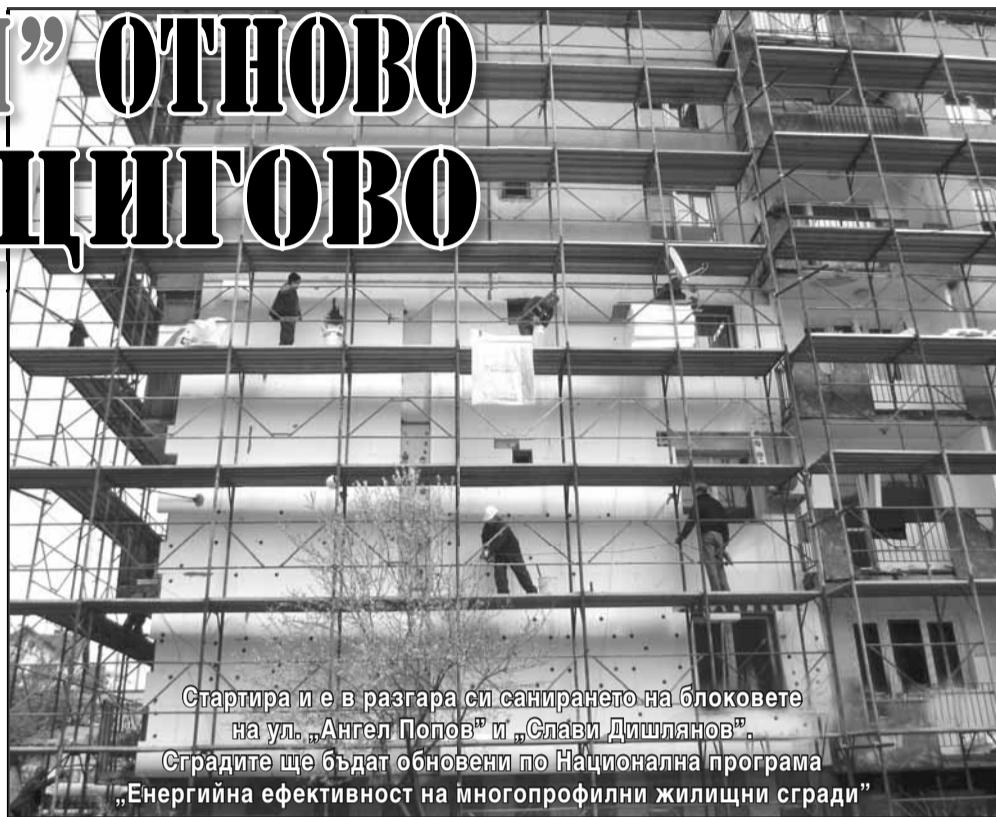
Стартира и е в разгара си санирането на блоковете на ул. „Ангел Попов“ и „Слави Дишлянов“.