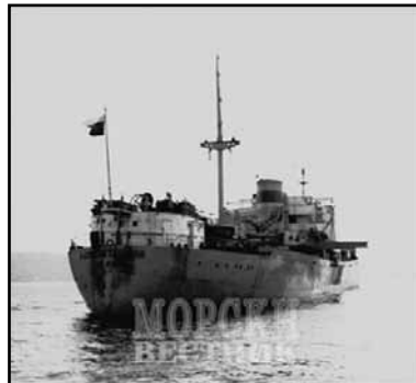
Моторният кораб „Васил Петлешков“ във Варненския залив, поглед откъм кърмата на кораба

Така през м. юни 1976 г. моторният кораб „Васил Петлешков“ доставя във Варна (в разглобен вид) моторния катер „Водолаз 1“, произведен в СССР за нуждите на Дирекцията за поддържане акваторията на пристанищата и морските канали.