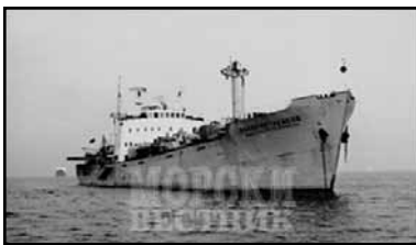
Моторният кораб „Васил Петлешков“ във Варненския залив, поглед откъм носа на кораба

Снимки на моторния кораб „Антарес“ („Васил Петлешков“ - ИМО 5148596). Сега, по повод 50-годишнината от приемането на кораба в състава на търговския флот на България, представяме на читателите на „Априлци“ снимки на кораба, вече с името „Васил Петлешков“, което получава по силата на Указ №191 от 22 януари 1970 г. на Президиума на Народното събрание.